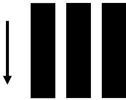
(ก) โครงสร้างเผด็จการ ใช้อำนาจสั่งการจากบนลงล่าง