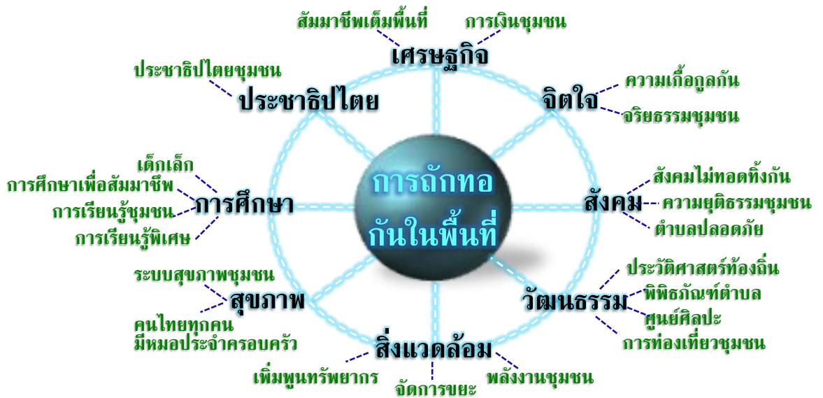
รูปที่ ๔ การถกทอกันทำงานในพื้นที่สู่การพัฒนาอย่างบูรณาการ ๘ เรื่อง

เป็นปัจจัยแก่กันและกัน จะพัฒนาแต่ละเรื่องแบบแยกส่วนนั้นยากลำบากหรือเป็นไปได้ เช่น