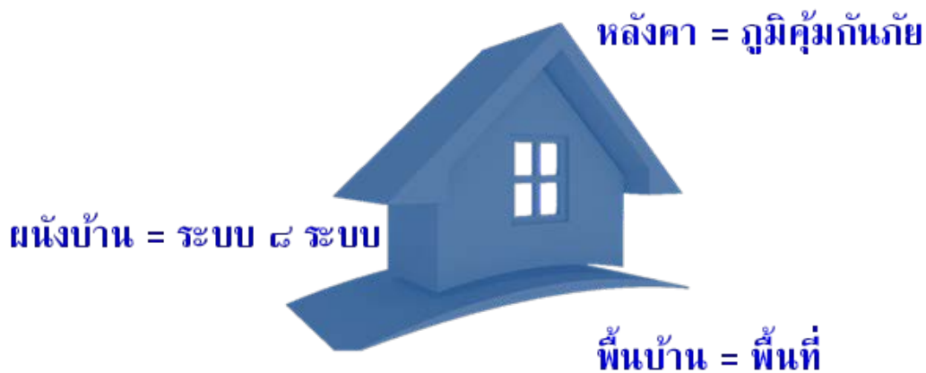
รูปที่ ๒ โครงสร้างบ้านประเทศไทย