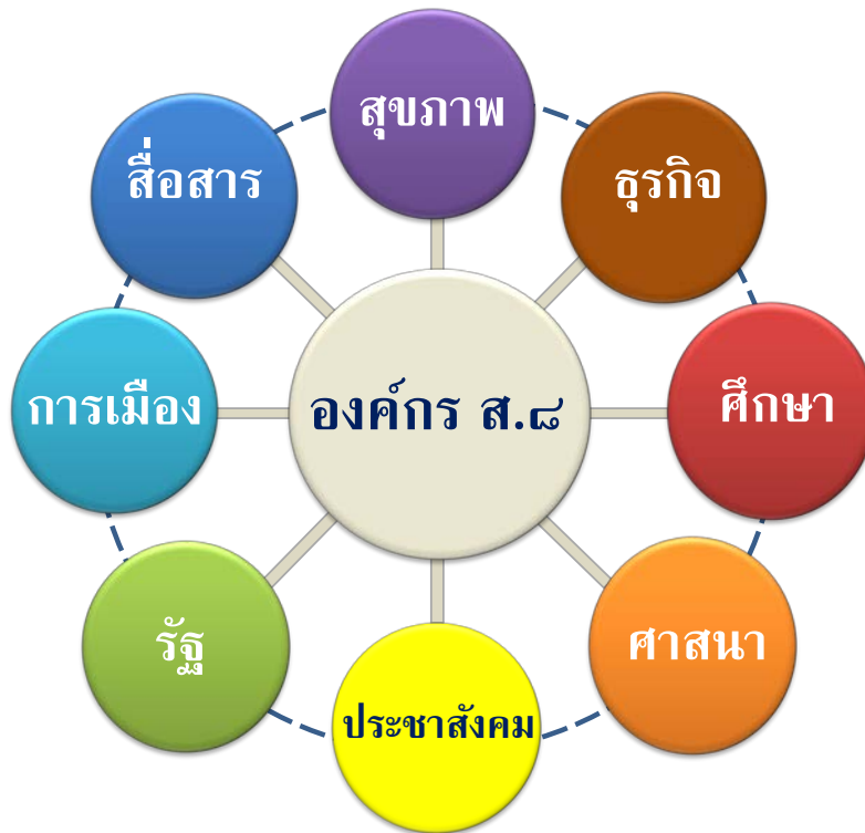
รูปที่ ๔ ฟันเฟืองในการขับเคลื่อนการพัฒนาประเทศไทยอย่างบูรณาการ

นี่คือการฉีกกำลังของคนทั้งมวล เพื่อสุขภาวะของคนทั้งมวล หรือ